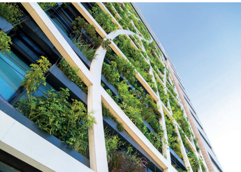
Illustration non contractuelle ne constituant pas un engagement quant aux futures acquisitions de la SCPI.