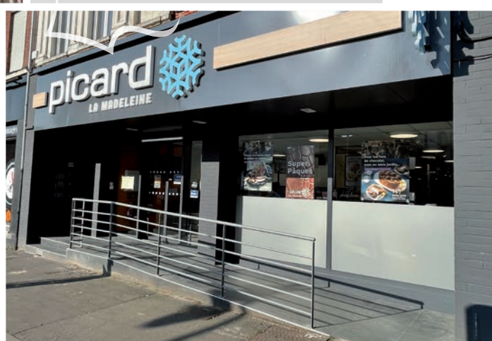
Picard, La Madeleine - Lille

Les photographies concernent des investissements déjà réalisés, à titre d'exemples, mais ne constituent aucun engagement quant aux futures acquisitions de la SCPI. Les actifs ne sont pas nécessairement représentatifs du patrimoine du fonds.