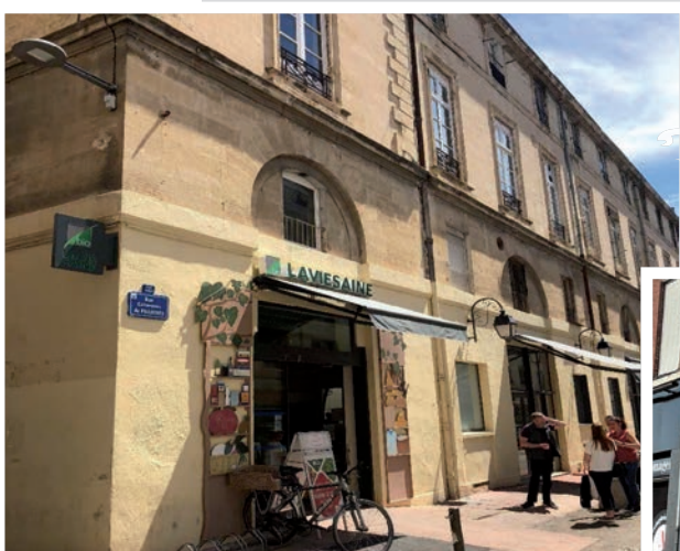
La Vie Saine, Montpellier