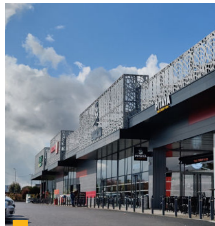
Retail Park à Tours (37)

**** Jusqu'à 2020 : TDVM. À partir de 2021 : Taux de distribution.