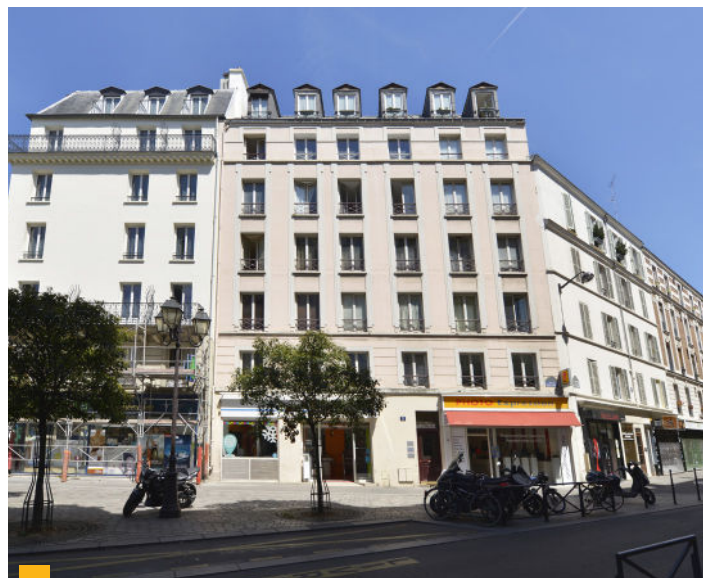
2 rue de Beccaria à Paris (75012)