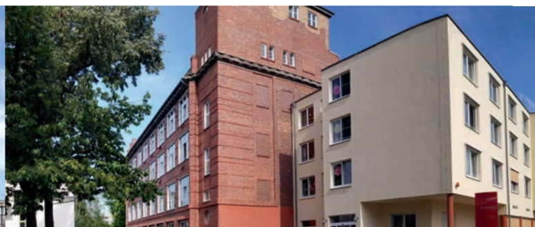
EHPAD Alzheimer - Guben (Allemagne)*