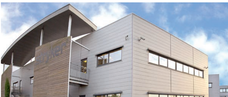
SIÈGE SOCIAL STRYKER - Pusignan (Lyon)*